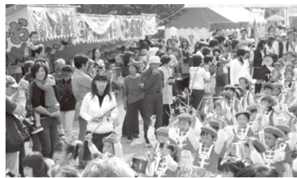
▲園児鼓笛隊パレード