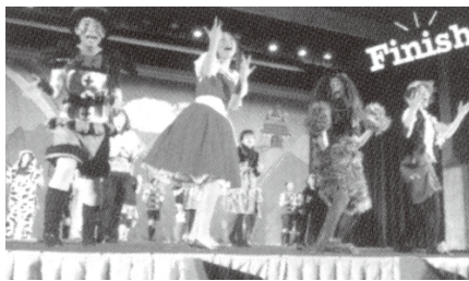
▲オペレッタ上演会