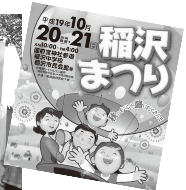
稲沢まつりポスター▲