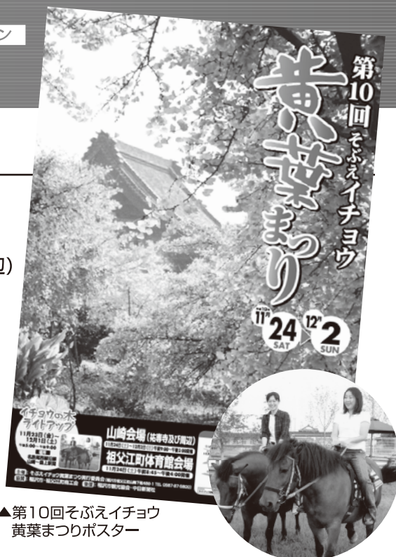
▲第10回そぶえイチョウ黄葉まつりポスター