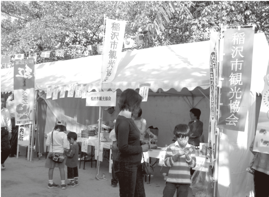
▲稲沢市観光協会ブース

今年は「親と子の絆」をテーマに家族そろって楽しむイベントが沢山、楽しさ、面白いっぱいの次のイベントが繰り広げられます。