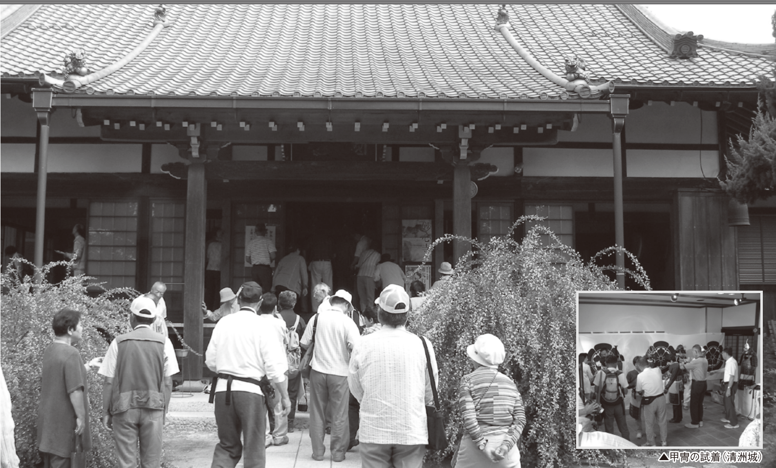
▲甲冑の試着(清洲城)