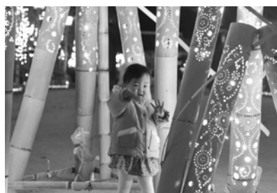
昨年のフォトコンテスト最優秀賞作品

☆イベントの目玉として、11月12日にスカイランタンを打ち上げます。 (60基、3,000円/基)※事前予約が必要です。