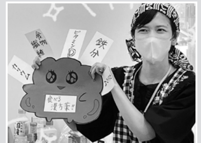
(株)きくらげファーム稲沢 (広報1号さん)

メニューは、①キンパ、②具だくさんのそうめん揚げ、③生キクラゲと卵のスープ、④大根と油揚げのおひたし、⑤いちじくの杏仁豆腐でした。