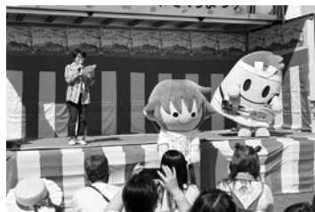
第29回へいわさくらまつり