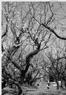
◆最優秀賞(稲沢市長賞)◆ 「春を感じて」 土井 章義 【知多市金沢】