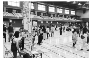
メーデーファミリーフェスティバル