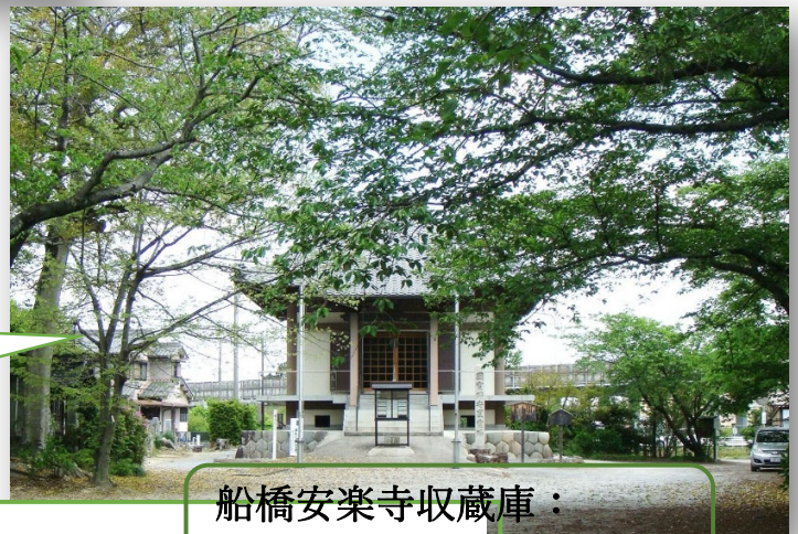
船橋安楽寺収蔵庫： 重要文化財(藤原時代) 3体